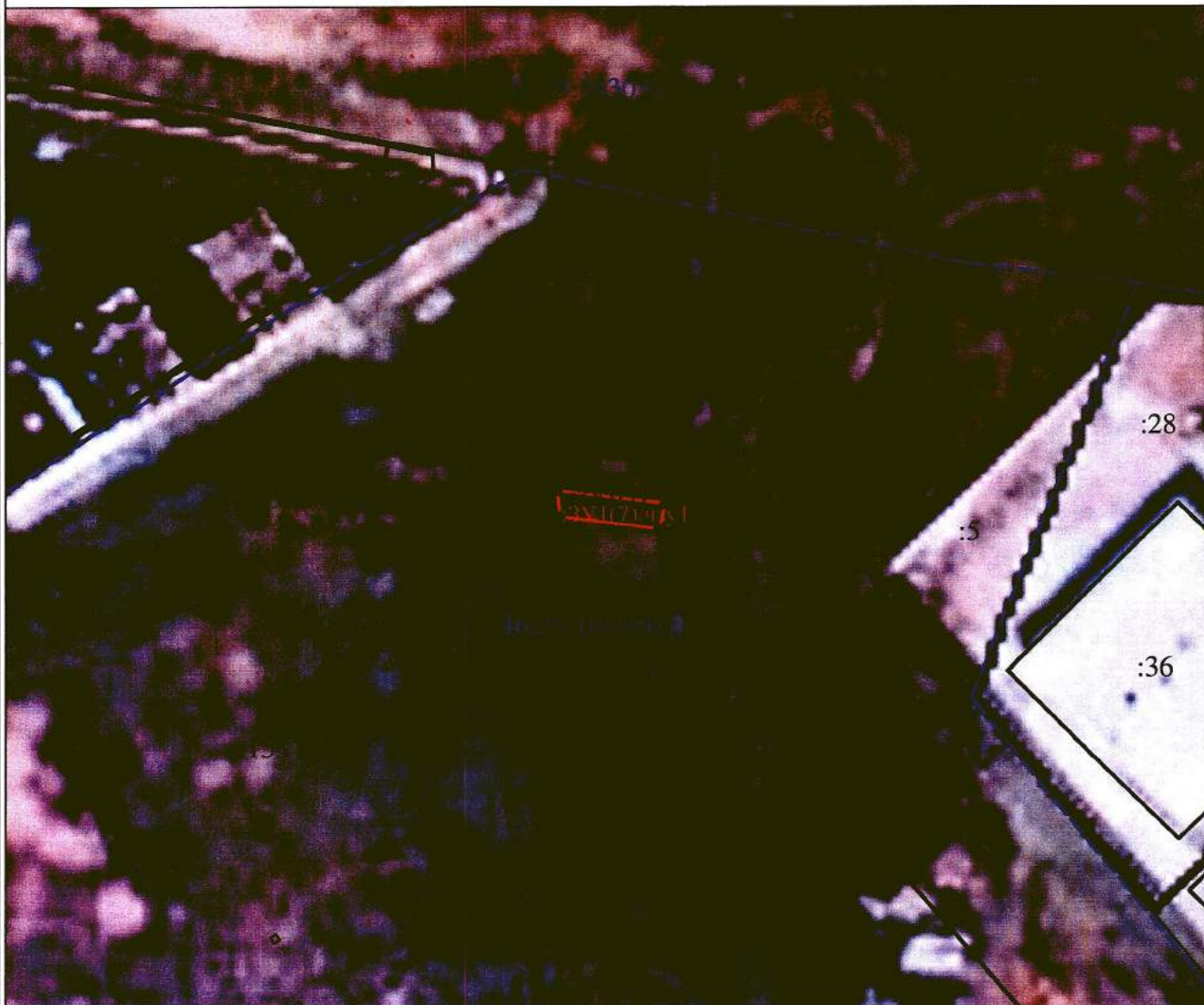
Схема границ публичного сервитута