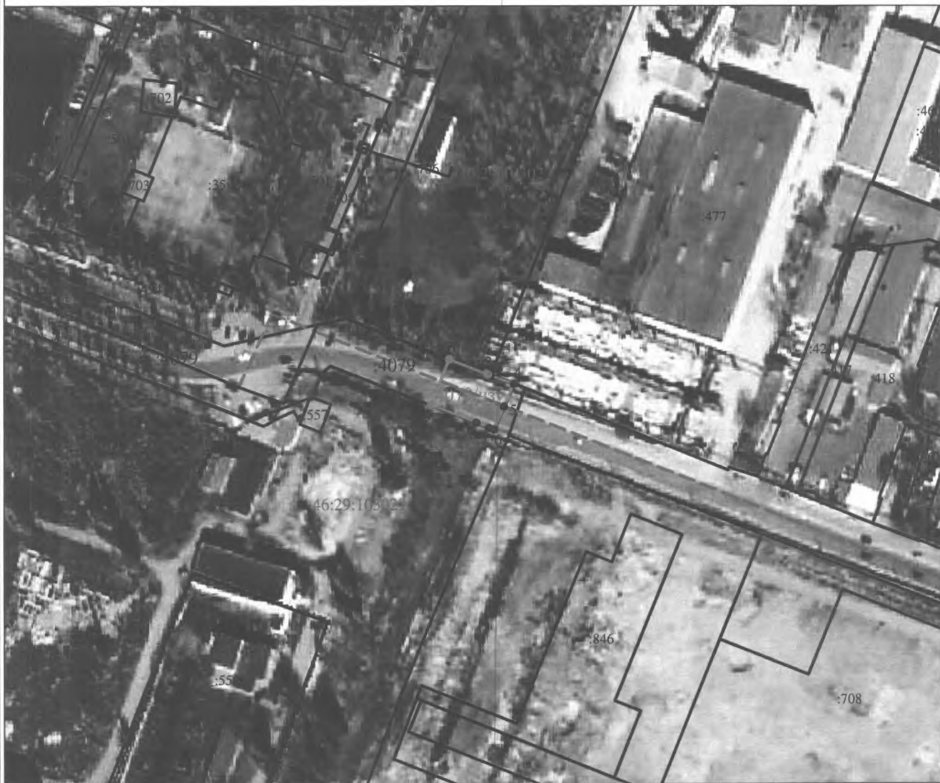
Схема границ публичного сервитута