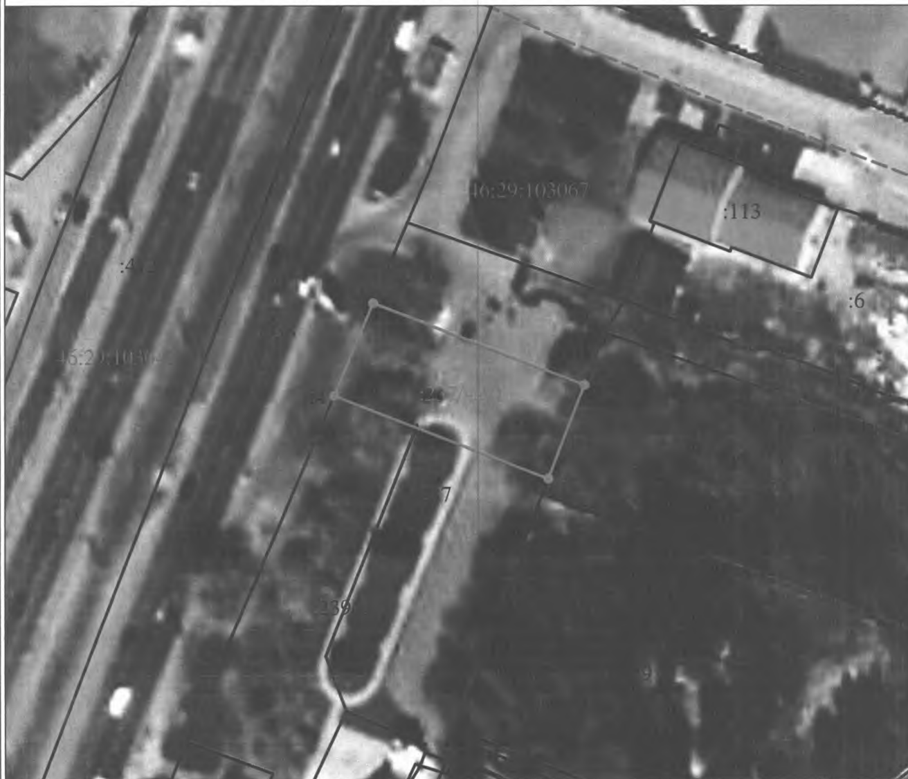
Схема границ публичного сервитута