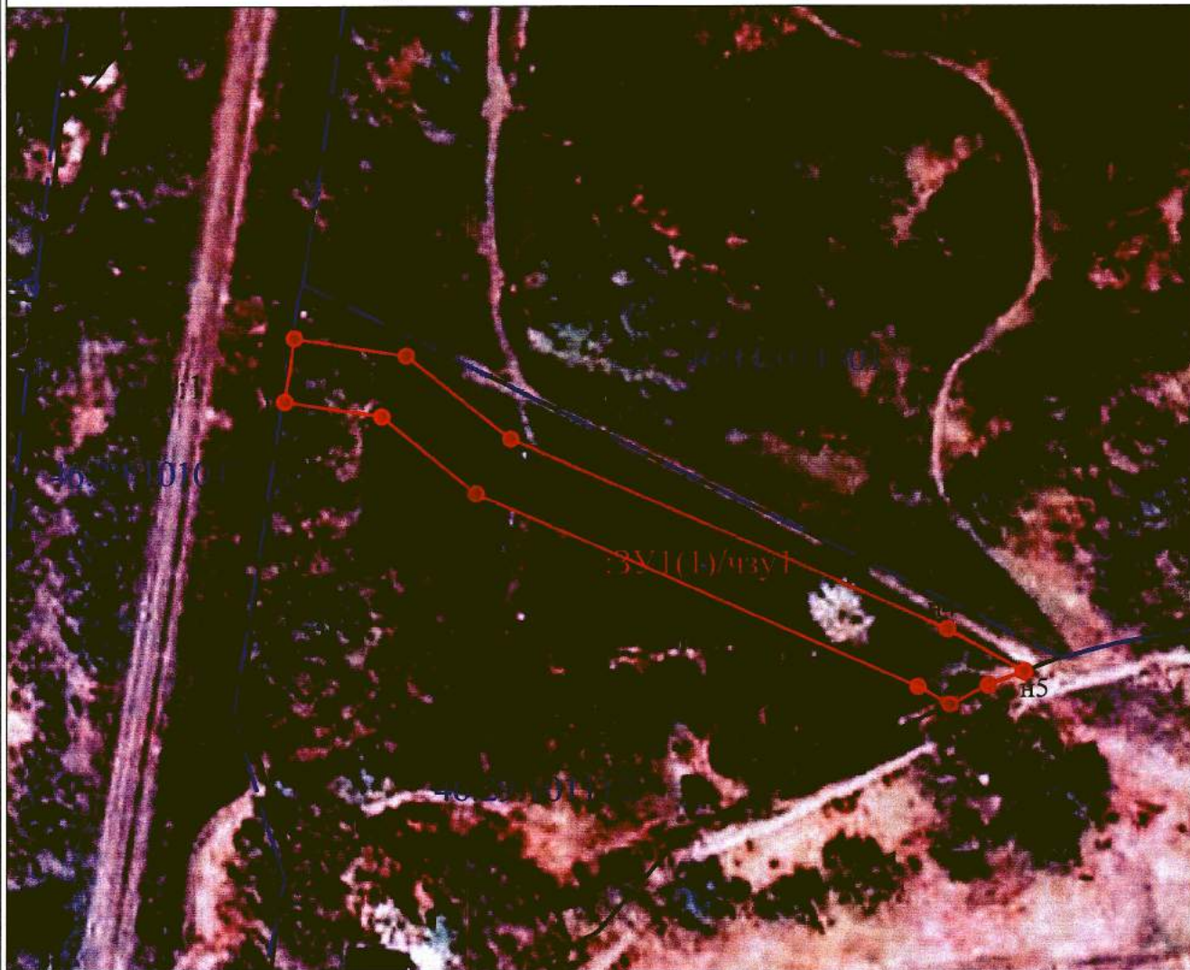
Схема границ публичного сервитута

ПРИЛОЖЕНИЕ 2 к распоряжению Администрации города Курска от "17" января 2023 года № 127-па