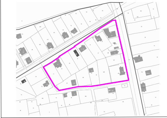
СХЕМА НА КАДАСТРОВОМ ПЛАНЕ ТЕРРИТОРИИ