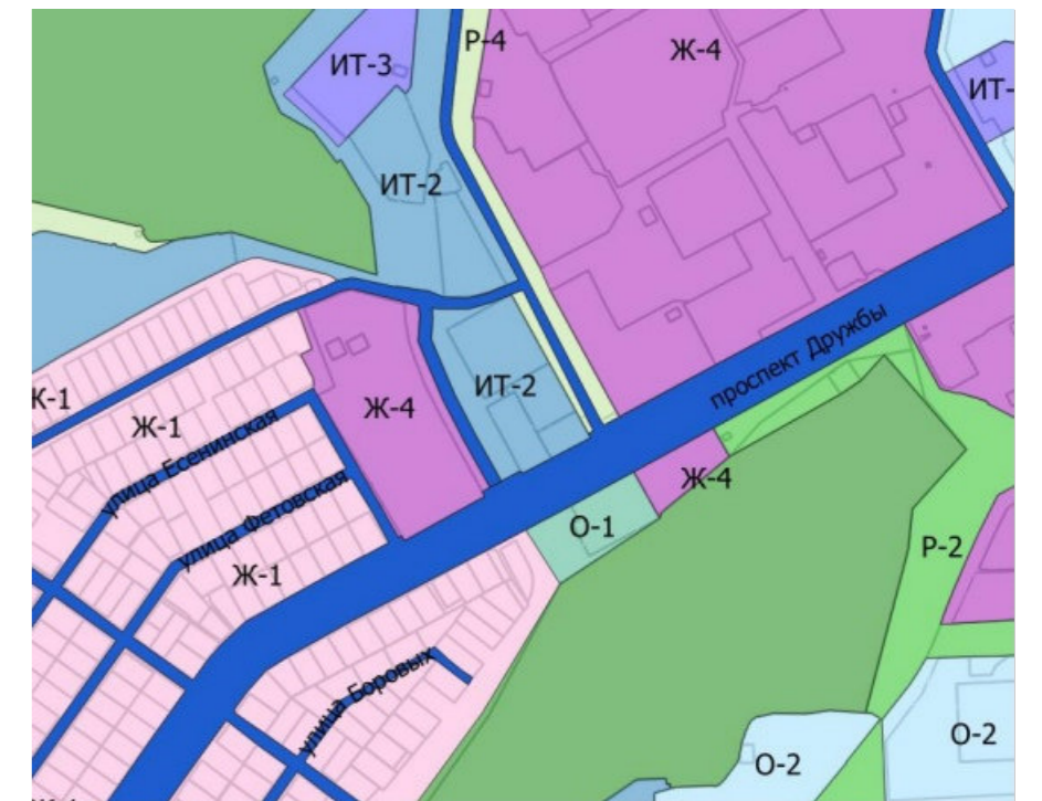
СХЕМА НА КАРТЕ ГРАДОСТРОИТЕЛЬНОГО ЗОНИРОВАНИЯ