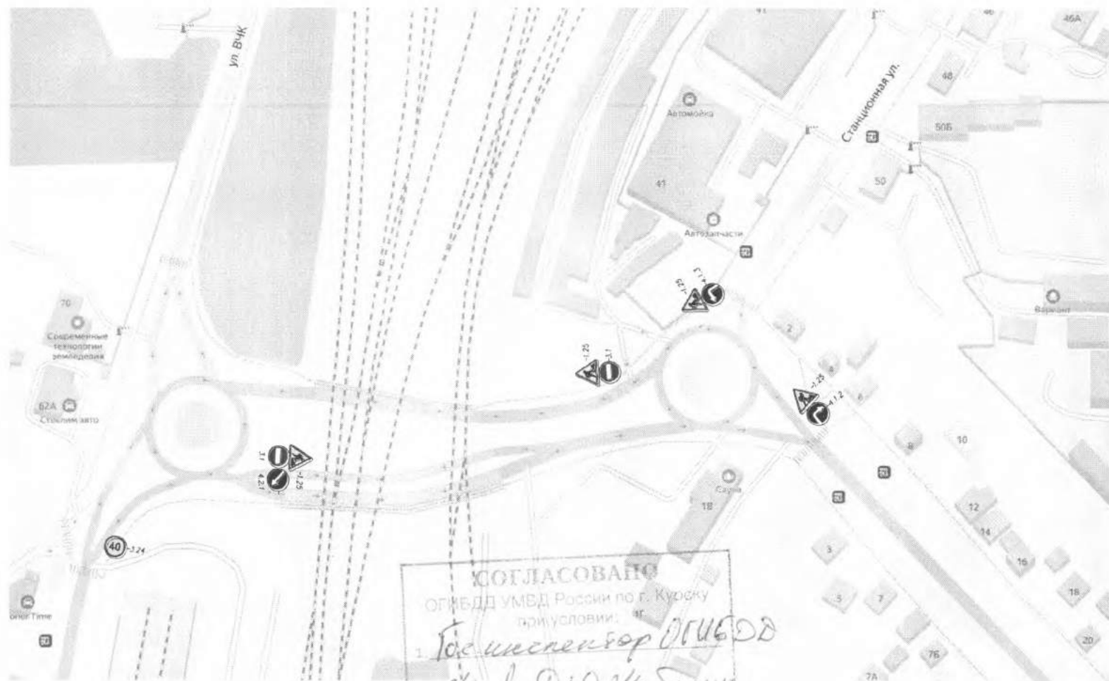
Схема временного ограничения движения под путепроводами по ул. ВЧК – ул. Станционная – ул. 2-я Новоселовка – ул. Чайковского на период выполнения работ по ямочному ремонту (часть 2)

СОГЛАСОВАНО ОГИБДД УМВД России по г. Курску при условии: 1. Юсиспектор ОГИБДД 2. Мед ДЮ Шабакин 22.03.2023