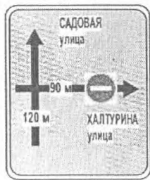
Знаки индивидуального проектирования

СОГЛАСОВАНО КОМИТЕТ ДОРОЖНОГО ХОЗЯЙСТВА ГОРОДА КУРСКА [Signature] должность _____ подпись _____ расшифровка _____ « _____ » _____ 20__ г.