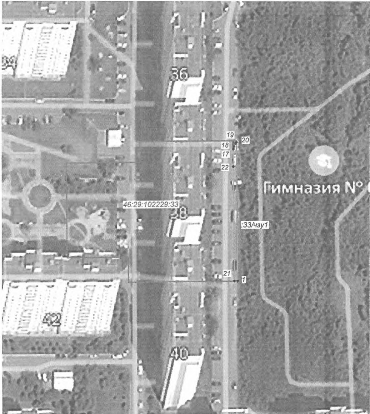
Схема границ публичного сервитута

ПРИЛОЖЕНИЕ 2 к постановлению Администрации города Курска от "25" октября 2023 года № 600